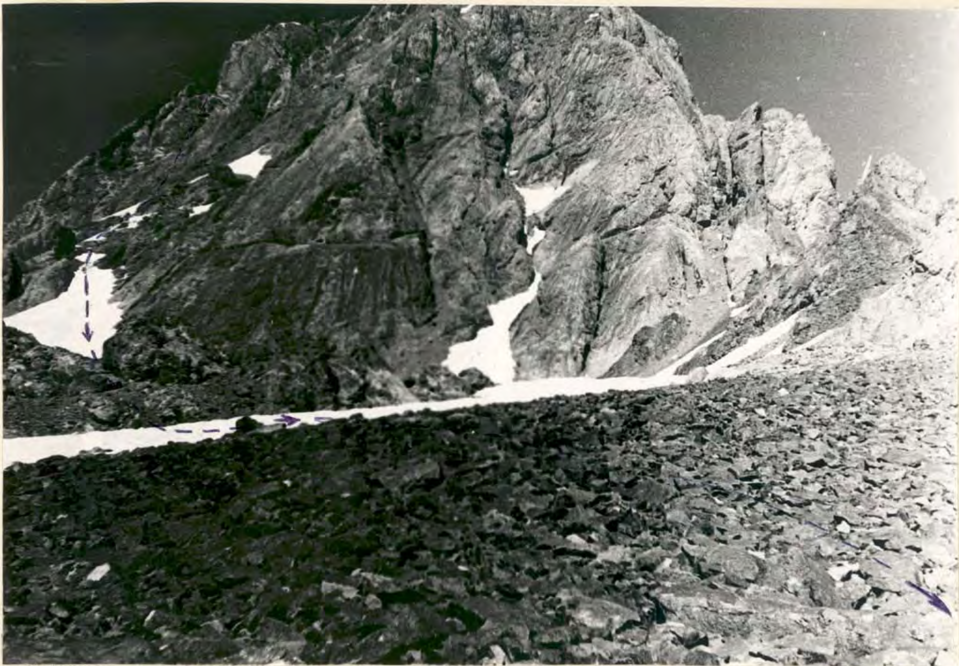
Рис. 2 Пик Блок. Маршрут 3 А к.т. с перемычкой между в. Красная Москва и п. Блок со стороны в. Сахарная голова ( вариант спуска в сторону ледника Сказский и на ночевки ).