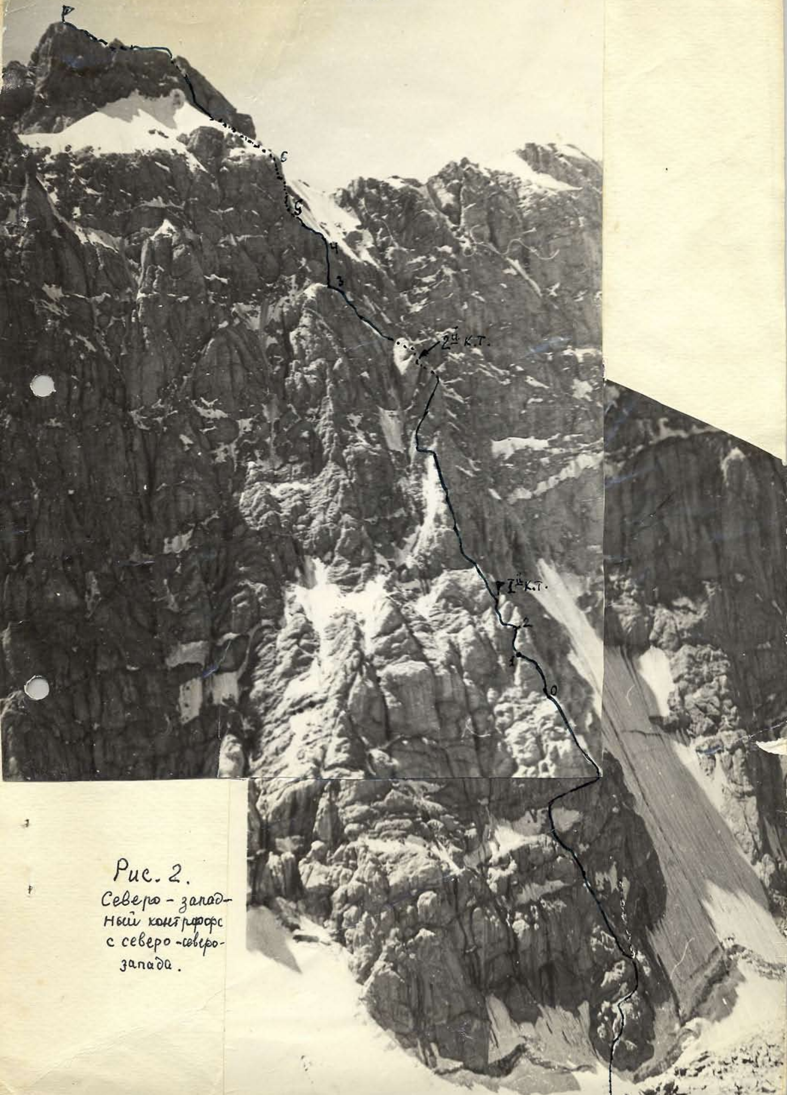
Рис. 2. Северо-запад- ный контур с северо-северо- запада.