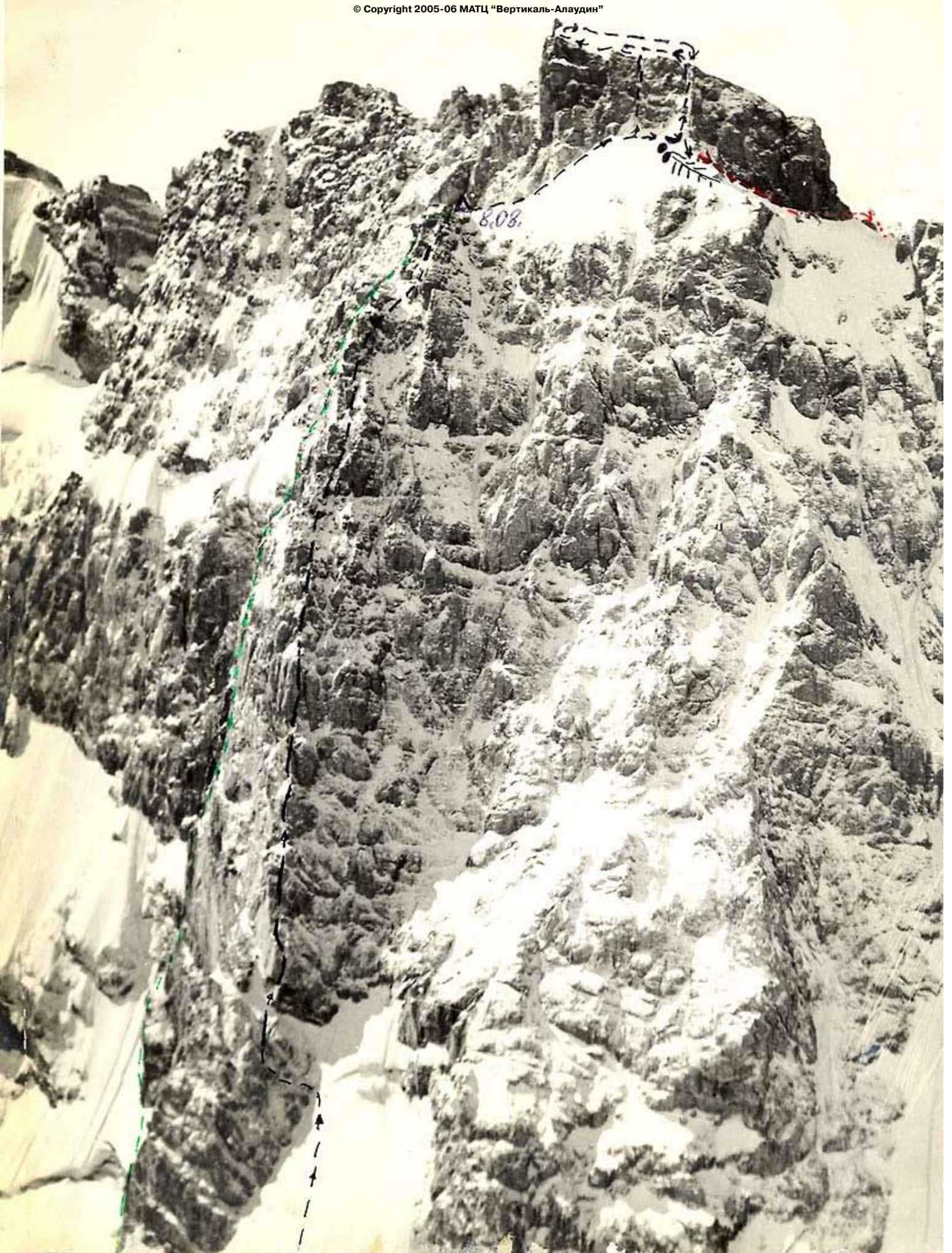
Центральная вершина Залин-Караар С контрфорсе